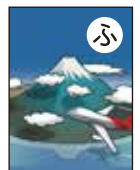
ふちまで 図柄あり